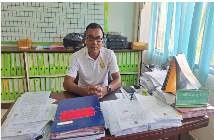
ยื่นข้อร้องเรียนด้วยตนเองกับเจ้าหน้าที่