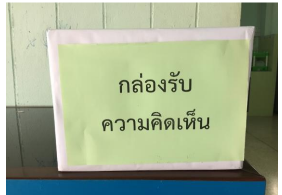
กล่องรับความคิดเห็น