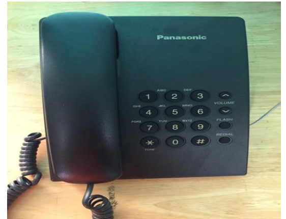
ร้องเรียนผ่านโทรศัพท์สำนักงาน เบอร์ ๐ ๗๗๒๙ ๒๐๗๖