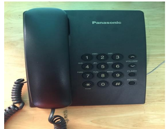
ร้องเรียนผ่านโทรศัพท์สำนักงาน เบอร์ ๐ ๗๗๒๙ ๒๐๗๖