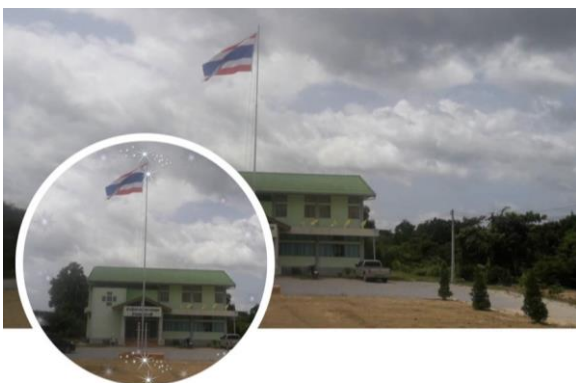
สสอ. วิภาวดี