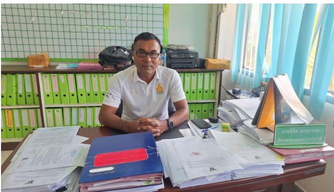
ยื่นข้อร้องเรียนด้วยตนเองกับเจ้าหน้าที่